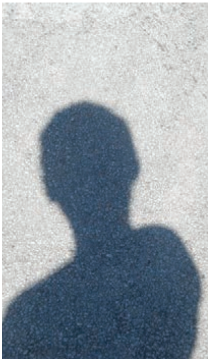
En été, les ombres sont petites, en hiver, elles s'allongent

Le monde actuel est curieux. On y croise des personnes apparemment saines, bien dans leur tête, qui soudainement passent « sur la tranche », dans un déchainement de violence et de passion. « Jamais on aurait cru cela d'elles, dira-t-on. » Ce mal nouveau, et bien d'autres, ne sont peut-être que le reflet d'une personnalité pas bien assise. Prendre conscience de son ombre, selon la pédagogie de Jean Monbourquette et Carl Jung peut alors offrir un véritable épanouissement et changer le cours d'une vie.